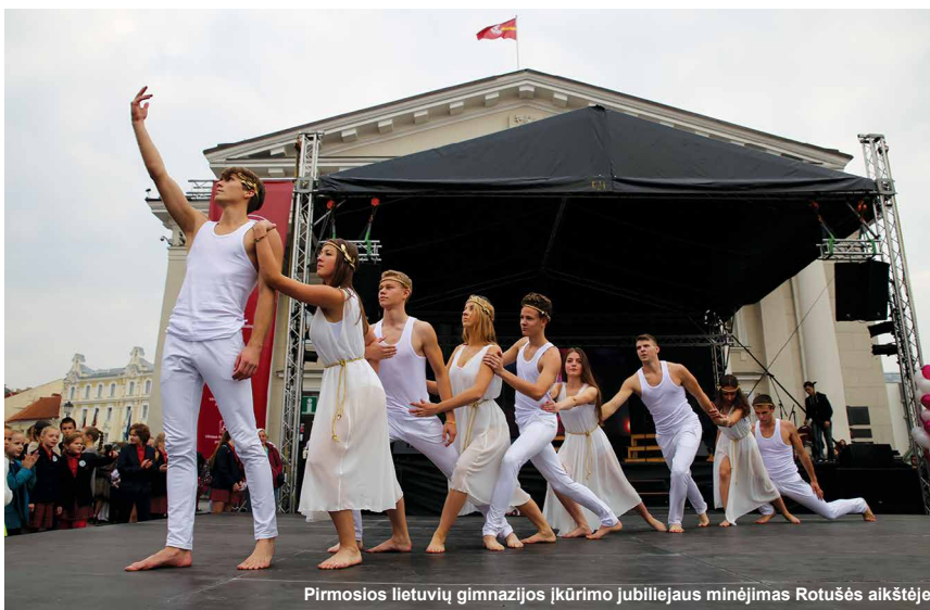
Pirmosios lietuvių gimnazijos įkūrimo jubiliejaus minėjimas Rotušės aikštėje

mokinių, kurie yra smalsūs, aktyvūs, kūrybiški, greitai besimokantys ir geriausių ugdymosi rezultatų siekiantys Lietuvos vaikai – mūsų šalies ateities kūrėjai. Visos keturios mokyklos yra ir stiprios bendruomenės, į kurių gyvenimą aktyviai ir atsakingai įsitraukia ir tėvai: nuo sprendimų, susijusių su mokinių ugdymusi, priėmimo iki bendruomenės švenčių organizavimo ir dalyvavimo jose. Mokyklos turi ir platų socialinių partnerių tinklą, bendradarbiauja ne tik tarpusavyje, bet ir rengia bendrus projektus su kitomis šalies ir užsienio organizacijomis. Šiandien šios mokyklos yra vienos iš tų, kurios rodo pavyzdį kitoms Lietuvos ugdymo įstaigoms, dalijasi savo patirtimi, idėjomis, vizija.