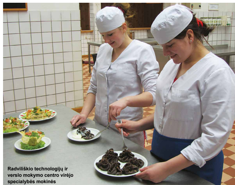
Radviliškio technologijų ir verslo mokymo centro virėjo specialybės mokinės