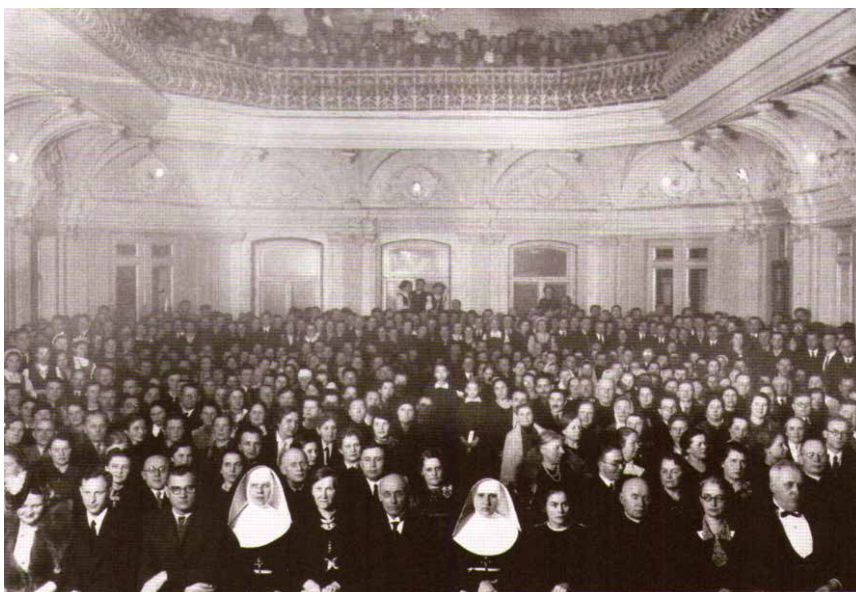
Vasario 16-osios minėjimas Vytauto Didžiojo gimnazijos salėje. 1935 m.

Visos keturios mokyklos yra savitos, autentiškos, turinčios savo dvasią, kultūrą ir susiformavusios ugdymo vertybėmis pagrįstą savo tapatybę. Jos dar iki dabar puoselėja pirmajai lietuvių gimnazijai svarbias vertybes – tautiškumą, lietuviybę, gimtąją kalbą, tautos istoriją, pilietiškumą, demokratiją, humaniškumą, pagarbą žmogui ir meilę tėvynei. Kiekvienoje iš jų dirba puikūs pedagogai, kurie yra ne tik savo sričių profesionalai, tačiau ir sąmoningi šių dienų mokyklos formuotojai. Kiekvieną dieną dirbami prasmingą darbą ir organizuodami gausybę ugdymosi veiklų, jie nenukrypsta nuo mokyklos šaknų ir pedagogo laikysenos, kurią savo pavyzdžiu pabrėždavo gimnazijos įkūrėjai, garsūs mokytojai, šią mokyklą baigę, o vėliau edukologijos srities mokslininkais tapę mokiniai. Šiandien Vytauto Didžiojo, Salomėjos Nėries gimnazijas, Antano Vienuolio progimnaziją ir Vytės Nemunėlio pradinę mokyklą lanko beveik 3 tūkst.