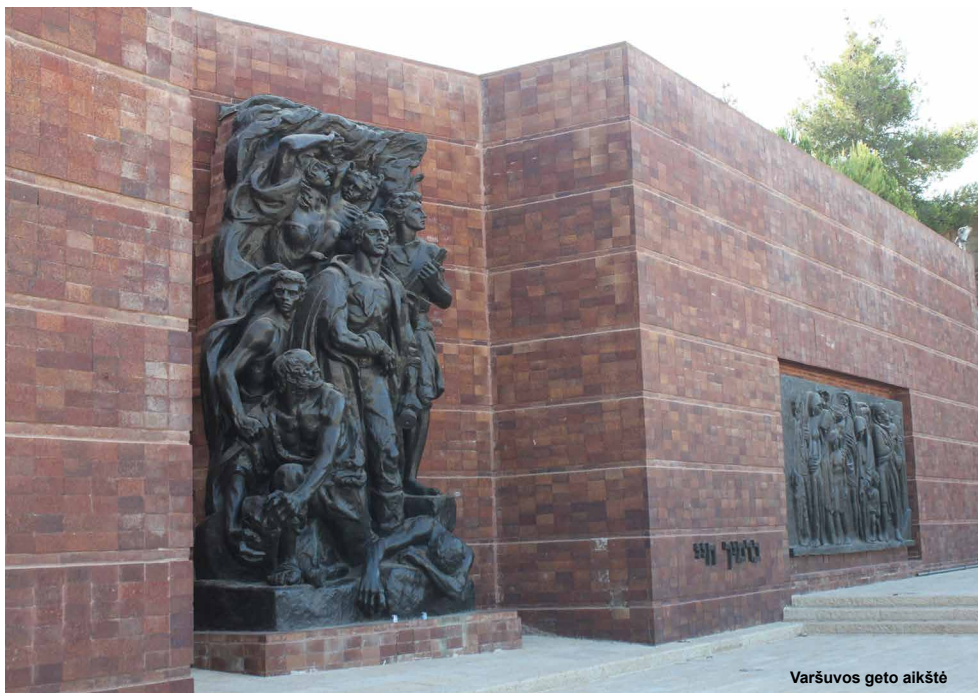
Varšuvos geto aikštė

Seminaro metu sutikome daug įdomių lektorių, kurie supažindino su Izraelio istorija, religija, tradicijomis, pristatė naujausius holokausto temų tyrinėjimus ir kt. Iš viso buvo organizuota daugiau kaip 30 paskaitų, diskusijų, ekskursijų. Užsiėmimai vyko kasdien nuo ryto iki