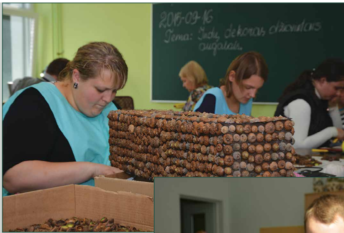
Būsimieji floristai mokosi dekoruoti džiovintais augalais

Atsakymą parengė Specialiosios pedagogikos ir psichologijos centro specialistai